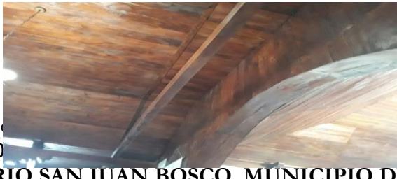
En la madera ya no se ve presencia de carcoma

SEDECOAS y el representante legal de la Asociación no Gubernamental DIAZO SONGANO del Sur, por un monto de UN MILLÓN SEISCIENTOS SETENTA Y NUEVE MIL CUATROCIENTOS CATORCE LEMPIRAS CON SESENTA Y UN CENTAVOS (L. 1,679,414.61) , la asociación no cumplió con algunas especificaciones técnicas como ser; no realizar una buena conformación y/o compactación de la base sub rasante eficiente que sirva para el apoyo de las losas de pavimento, lo que provocó un asentamiento diferencial es decir un Fracturamiento de la losa aproximadamente paralela al eje de la carretera, dividiendo la misma en dos planos. Con una longitud total de 58.69 ML , divididas en ambos carriles a un precio unitario total del proyecto de L. 1,174.42 por M 2 , con anchos de grieta