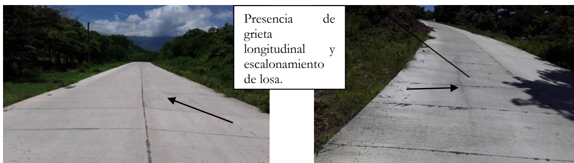
Fotografía 17 y 18: Vista de parte del tramo pavimentado hacia la aldea Loma Larga en el que se observan fallas estructurales en la losa.

Determinándose así en dicha inspección In Situ la cantidad de veintisiete (27) losas de concreto hidráulico dañadas, es decir una Falla Estructural por el agotamiento longitudinal en la misma, que equivalen a cuarenta y ocho (48.30) metros lineales con anchos de grietas que varían entre los 6 mm y 45 mm (0.6-4.5 cm) a un costo unitario de SEIS MIL SEISCIENTOS CINCUENTA Y UN LEMPIRAS CON VEINTINUEVE CENTAVOS (L. 6,651.29) por Metro Lineal, produciendo daños que ascienden a la cantidad de TRESCIENTOS VEINTE UN MIL DOSCIENTOS CINCUENTA Y SIETE LEMPIRAS CON DIEZ CENTAVOS (L. 321,257.10).