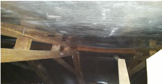
Lamina lisa reparada

Se notificó a los responsables de la ejecución de la obra así como al Personal de la de la Dirección de Control y Seguimiento de Proyectos, sobre estas deficiencias determinadas por este Ente Fiscalizador, quienes aceptaron las mismas y se procedió de manera inmediata la subsanación de dichas obras por la empresa R & M, mismas que ascendieron a la cantidad de CINCUENTA UN MIL NOVECIENTOS VEINTINUEVE LEMPIRAS CON OCHENTA CENTAVOS (L. 51,929.80) , quedando así subsanadas las obras de acuerdo a las especificaciones y requerimientos técnicos, como se establecieron en los términos contractuales.