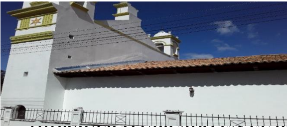
Flashing se ve en buen estado