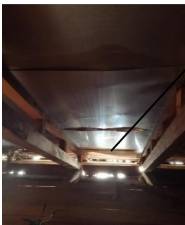
Se observó en todo el techo la lámina de aluzinc Lisa

El 30 de abril de 2021, el contratante y contratista suscriben bajo el ADENDUM N° 2 la ampliación de monto al contrato original por la cantidad de CIENTO OCHENTA Y CUATRO MIL DOSCIENTOS TREINTA Y SIETE LEMPIRAS CON OCHENTA CENTAVOS (L. 184,237.80) el monto adjudicado de contrato ahora asciende a la cantidad de CINCO MILLONES CIENTO DOCE MIL SEISCIENTOS TRECE LEMPIRAS CON DIECISIETE CENTAVOS (L. 5,112,613.17) , se observó que durante la ejecución del proyecto, la empresa constructora no cumplió con algunas especificaciones y requerimientos técnicos como ser; en la actividad de techo con estructura de madera y cubierta de teja de barro sobre lamina acanalada, se observó que la lámina que instalaron fue lisa, cielo de madera de color (tablones 1/2 X12), también que las dimensiones de los tablones, tienen varias dimensiones múltiples, ventanas de madera, el cavado de las mismas no se había realizado, es decir no estaban cepilladas, piso de cerámica tipo colonial para alto tráfico, se instaló cerámica de 31X31, el flashin de lámina de zinc, se observó que al llover existe filtración de agua, al tener estas deficiencias, causó que no se cumpliera con algunas especificaciones y requerimientos técnicos contratados, sin embargo, así se recepcionó el proyecto por parte de los beneficiados y funcionarios de IDECOAS/FHIS ahora SEDECOAS.