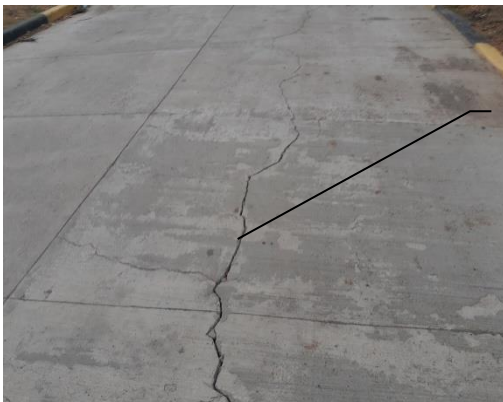
Fotografía 9 y 10: Vista de parte del tramo pavimentado donde se observa falla estructural en el pavimento hidráulico, de entre 5-25 mm.

Determinándose así en dicha inspección In Situ la cantidad de cuarenta y cuatro (44) losas de concreto hidráulico dañadas, es decir una Falla Estructural por el agotamiento longitudinal en la misma, que equivalen a un costo unitario de MIL CIENTO SETENTA Y CUATRO LEMPIRAS CON CUARENTA Y DOS CENTAVOS (L. 1,174.42) por metros lineales 260.48 m 2 , produciendo daños que ascienden a la cantidad de de TRESCIENTOS CINCO MIL NOVECIENTOS TRECE LEMPIRAS CON NOVENTA Y SIETE CENTAVOS (L. 305,913.97) .