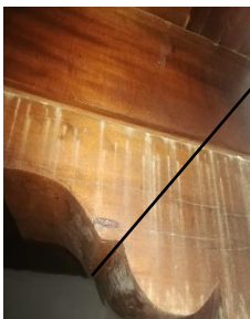
En la madera de color se presenta con carcoma.