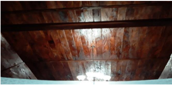
Los tablonces del cielo ya no se ve ondulada