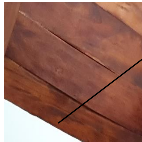
Tablones de madera de color con dimensiones múltiples