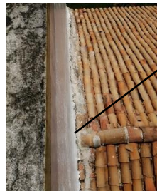
Flashin el cual existe filtración de agua cada vez que llueve