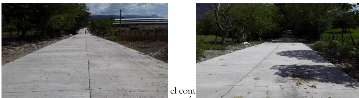
Fotografía 12 y 13: Vista del tramo reconstruido en La Isla, donde se observa una muy buena calidad de obra en la fundición de losas del pavimento

JN MILLÓN DOSCIENTOS DIECISIETE MIL TRES CIENTOS QUINCE CON NOVENTA Y SEIS CENTAVOS (L. 1,217,315.96) , por la Asociación Unidos Trabajando por el Desarrollo (UTRADE), responsable de la ejecución del proyecto, obras que se realizaron durante la ejecución de la auditoría.