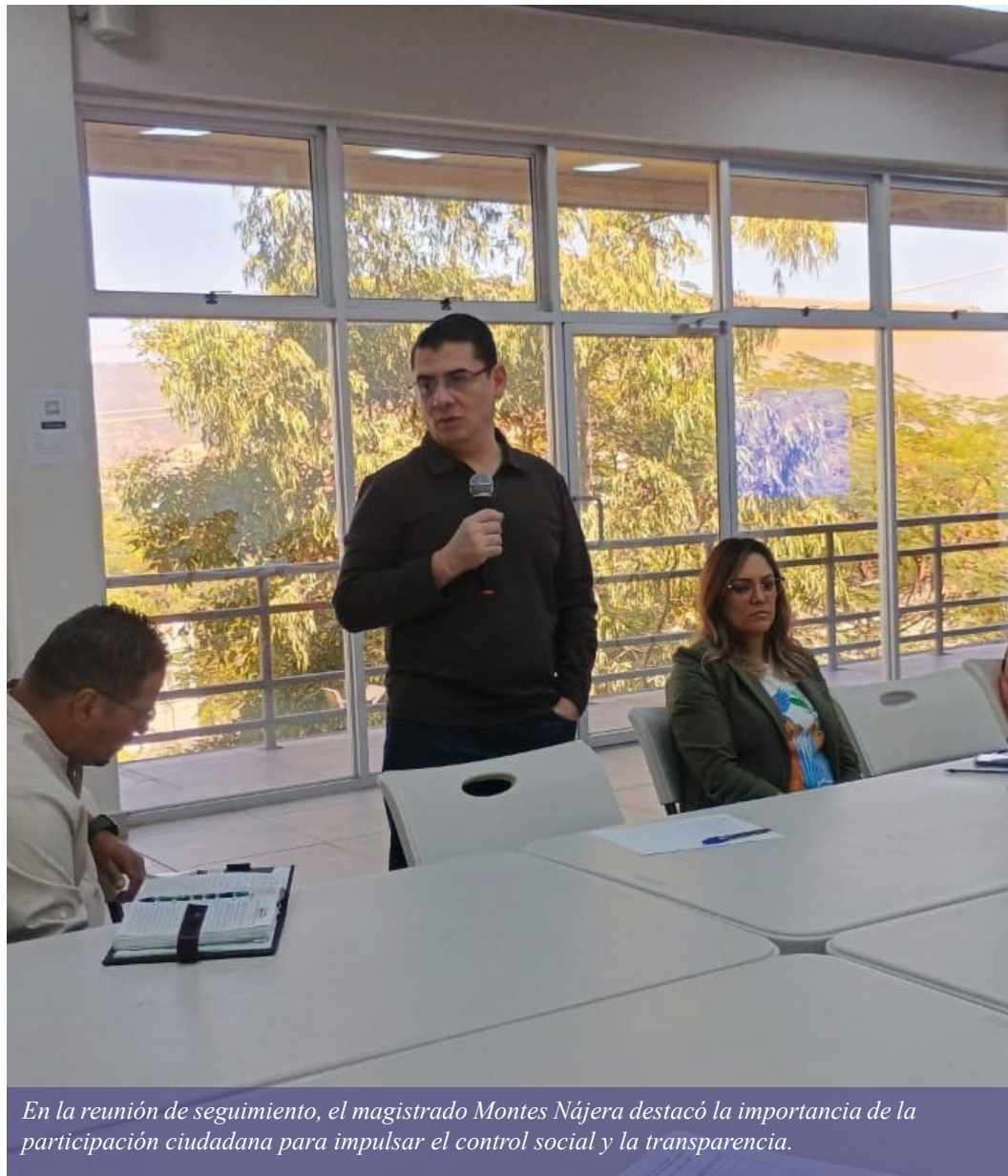
En la reunión de seguimiento, el magistrado Montes Nájera destacó la importancia de la participación ciudadana para impulsar el control social y la transparencia.

el interés de su colonia. El ciudadano debe incorporarse en las necesidades de su comunidad, sin ser espectadores, sino con una participación ciudadana activa”, manifestó el magistrado Montes.