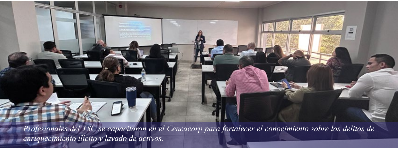
Profesionales del TSC se capacitaron en el Cencacorp para fortalecer el conocimiento sobre los delitos de enriquecimiento ilícito y lavado de activos.