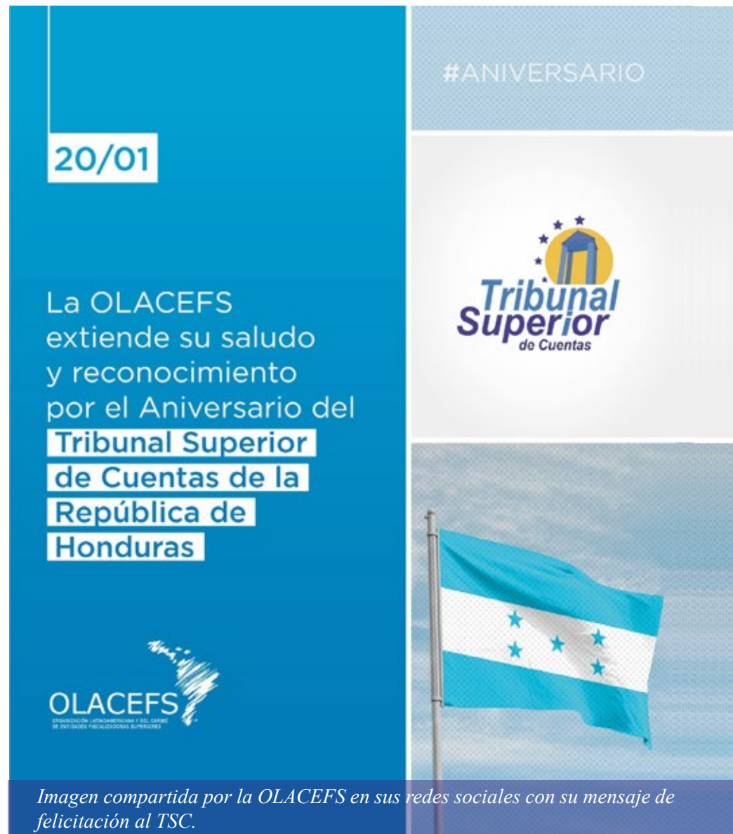
Imagen compartida por la OLACEFS en sus redes sociales con su mensaje de felicitación al TSC.

El TSC es miembro activo de la OLACEFS, organismo internacional, autónomo, independiente, apolítico y de carácter permanente que tiene por objetivo fomentar el intercambio experiencias y buenas prácticas relacionadas a la fiscalización y al control gubernamental, así como al fomento de las relaciones de cooperación y desarrollo