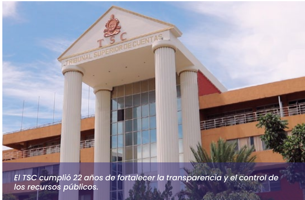
El TSC cumplió 22 años de fortalecer la transparencia y el control de los recursos públicos.

Igualmente, el actual Pleno cumple con el mandato normativo de promover la transparencia, la rendición de cuentas, la probidad y la ética en el ejercicio de la función pública. Mediante Decreto No 10-2002-E de cinco de diciembre de 2002, se aprobó la Ley Orgánica del Tribunal Superior