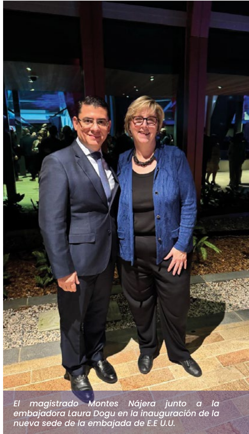
El magistrado Montes Nájera junto a la embajadora Laura Dogu en la inauguración de la nueva sede de la embajada de E.E U.U.

Las nuevas instalaciones de la Embajada de EE. UU en Honduras se ubican en la avenida La Paz, en Tegucigalpa, en los próximos meses se realizará el traslado con el inicio de operaciones en una fecha aún por confirmar.