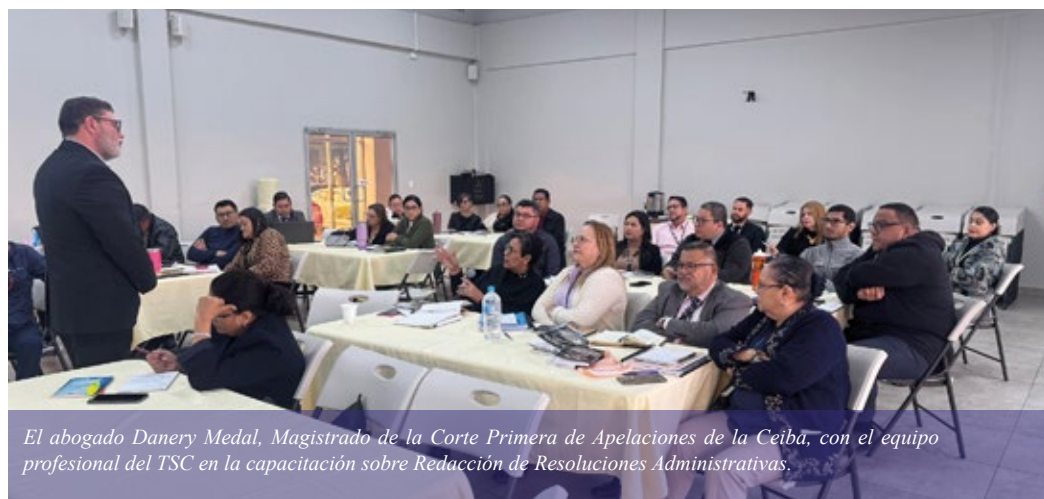
El abogado Danery Medal, Magistrado de la Corte Primera de Apelaciones de la Ceiba, con el equipo profesional del TSC en la capacitación sobre Redacción de Resoluciones Administrativas.

De esta manera el Pleno coordina la formulación e implementación de un Plan Integral de Capacitación alineado a la estrategia de recursos humanos y al cumplimiento de los objetivos operacionales del Ente Fiscalizador Superior del Estado.