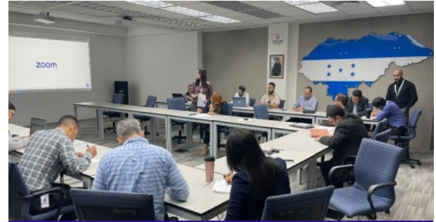
El TSC capacitó a personal de la DIGER, de la Secretaría de Energía, sobre el Código de Conducta Ética del Servidor Público y su Reglamento.

Finalmente, se ofreció una jornada de capacitación sobre Valores Éticos al alumnado del Centro de Educación Básica, Roberto Sosa, de la capital. La jornada formó parte del programa Rescatando Valores, que impulsa el TSC.