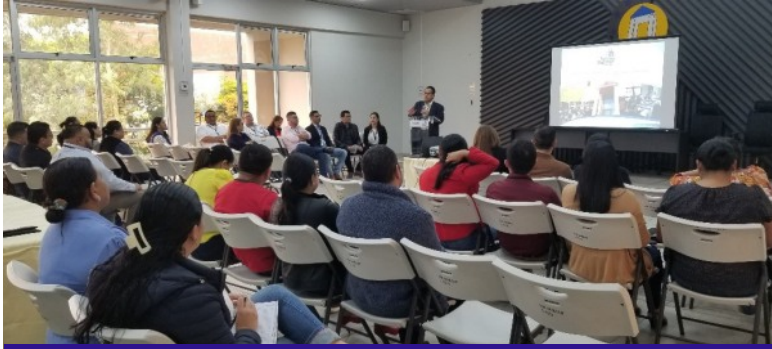
El conversatorio sobre Pliegos de Impugnación Dictaminados por las Gerencias de Auditoría Sectoriales del TSC fue gestionada por la Dirección de Impugnaciones.

Tegucigalpa. Un conversatorio sobre Pliegos de Impugnación Dictaminados por las Gerencias de Auditorías Sectoriales del Tribunal Superior de Cuentas (TSC) se efectuó con la finalidad de optimizar los resultados de los productos de fiscalización realizados en las instituciones del Sector Público.