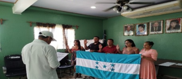
El TSC acompañó la juramentación del Comité de Probidad y Ética y Comité Adjunto del Ente Regulador de los Servicios de Agua Potable y Saneamiento y de la Municipalidad de Lajas.