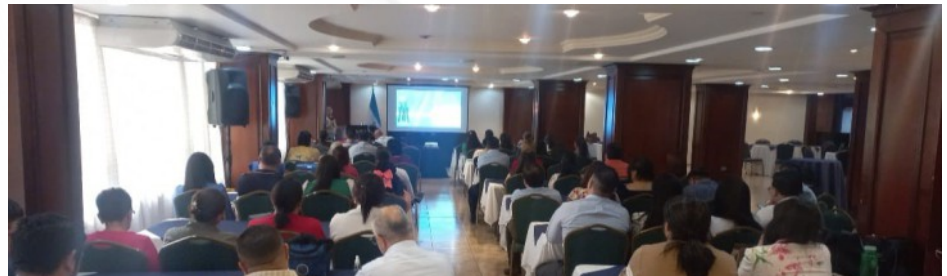
El TSC capacitó a personal del Instituto de Previsión Social de Empleados de la Universidad Nacional Autónoma de Honduras sobre el Código de Conducta Ética del Servidor Público y su Reglamento.