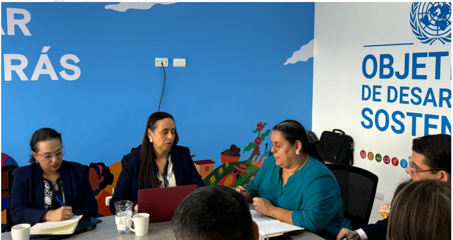
La reunión se llevó a cabo en la Casa de las Naciones Unidas con el propósito de conocer el trabajo que se está llevando a cabo desde el TSC para promover una rendición de cuentas, transparencia y lucha contra la corrupción.

Asimismo, se valoró, agradeció y se comparte el deseo de establecer acciones conjuntas orientadas a la obtención de buenos resultados en el control y fiscalización de los bienes y recursos del Estado.