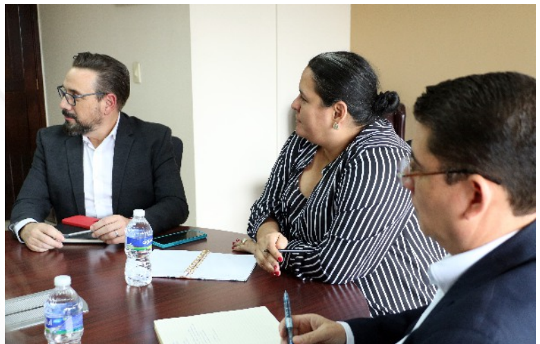
La reunión se llevó a cabo en el Salón del Pleno del TSC, en donde las autoridades de ambas instituciones abordaron temas de posibles acciones de coordinación, que abonen a la transparencia y la rendición de cuentas de cara a procesos electorales en el país.