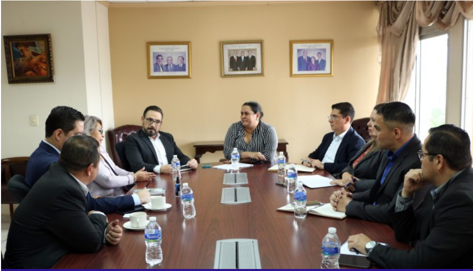
El Pleno del Tribunal Superior de Cuentas, junto a sus asesores, sostuvo una primera reunión de trabajo con los nuevos comisionados de la Unidad de Financiamiento, Transparencia y Fiscalización a Partidos Políticos y Candidatos.

Tegucigalpa. El Pleno del Tribunal Superior de Cuentas (TSC) recibió la visita de los nuevos comisionados de la Unidad de Financiamiento, Transparencia y Fiscalización a Partidos Políticos y Candidatos, con quienes se sostuvo una primera reunión de trabajo.