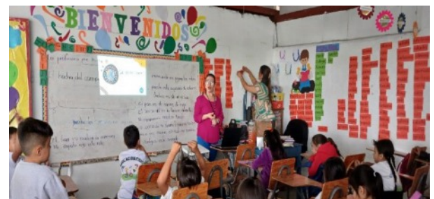
El TSC ofreció una importante jornada de capacitación sobre Valores Éticos al alumnado del Centro de Educación Básica, Roberto Sosa, de la capital.