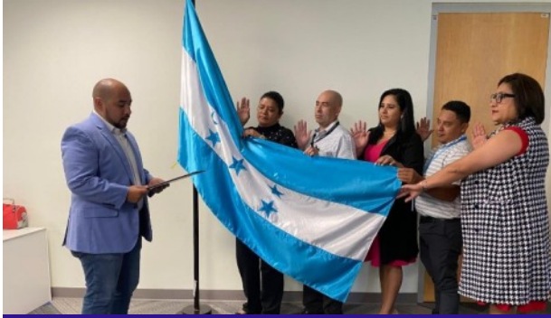
El TSC acompañó la juramentación del Comité de Probidad y Ética y Comité Adjunto de la Secretaría de Educación.

Tegucigalpa. El Tribunal Superior de Cuentas (TSC) mantiene como prioridad en el año 2024 la promoción de la probidad y la ética en las instituciones del sector público del Estado de Honduras.