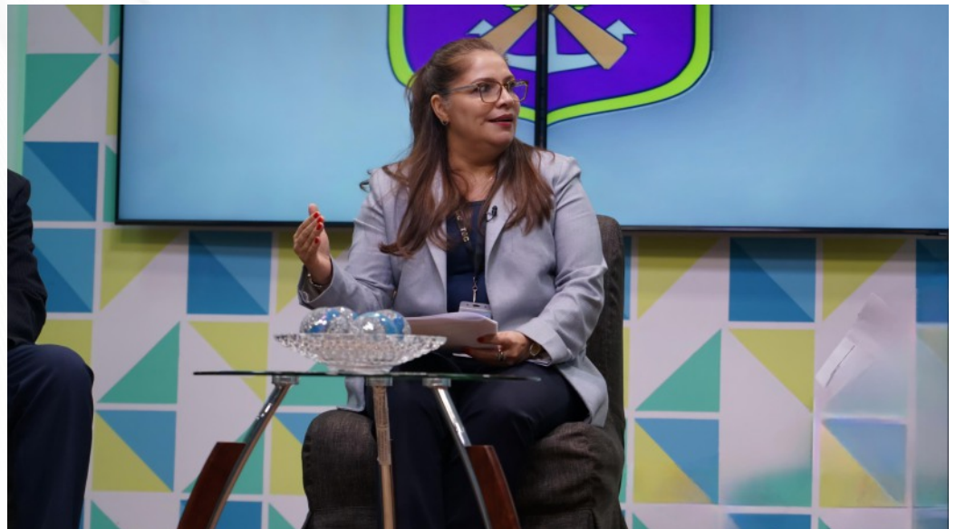
Durante la entrevista se destacó el rol del TSC en materia de promoción de valores en los servidores públicos, en especial mediante el acompañamiento en la elección y conformación de los Comités de Probidad y Ética de las instituciones del Sector Público.

del actual Pleno de Magistrados en optimizar la labor de control y fiscalización de los bienes y recursos del Estado.