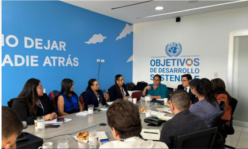
El Pleno de Magistrados del Tribunal Superior de Cuentas sostuvo una importante reunión con cooperantes de la Mesa de Transparencia y Buen Gobierno del G16.

La Mesa de Transparencia y Buen Gobierno es un espacio entre cooperantes del G16+ cuyo objetivo es intercambiar