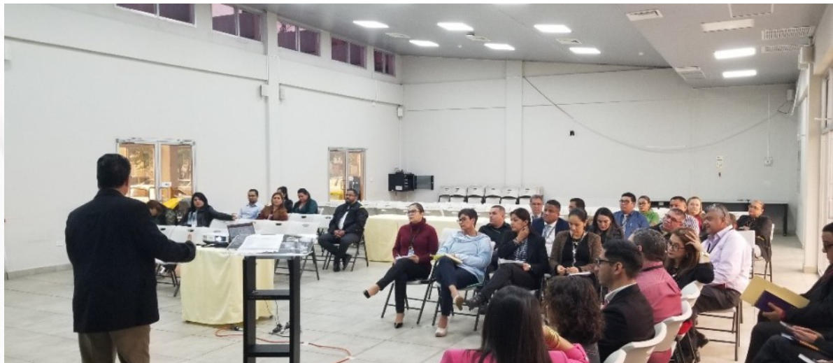
El conversatorio fue dirigido a personal de la Gerencia de Auditorías Sectorial, Desarrollo, Regulación Económica, Infraestructura Productiva, Recursos Naturales y Ambientales (GASEIPRA) y la Gerencia de Auditoría Sectorial Gobernabilidad e Inclusión Social, Prevención y Seguridad Nacional y Cooperación Internacional (GASGIPCSI), del TSC.

La actividad fue promovida por la Dirección de Impugnaciones y realizado el jueves 20 de junio en el Centro de Capacitación para el Control de los Recursos Públicos (Cencacorp), en horario de 9:00 a. m. a 12:00 m.