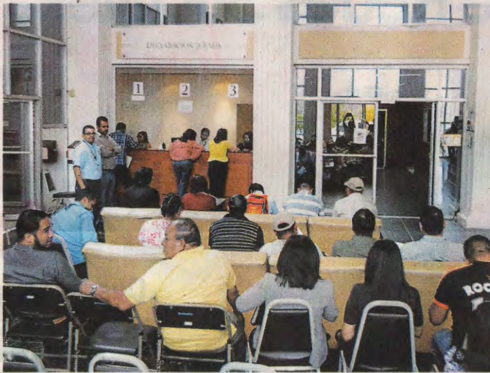
CONTRALOR. Instalaciones del Tribunal Superior de Cuentas en Tegucigalpa.

De las 109 notificaciones realizadas al Ministerio Público, no se conoce cuál es el estado