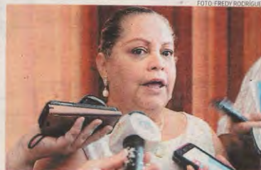
La magistrada del Tribunal Superior de Cuentas, Daisi de Anchecta, pidió a los concejales que renuncien.

Desde el año pasado, el Tribunal Superior de Cuentas advirtió del despilfarro en la Corte Suprema de Justicia