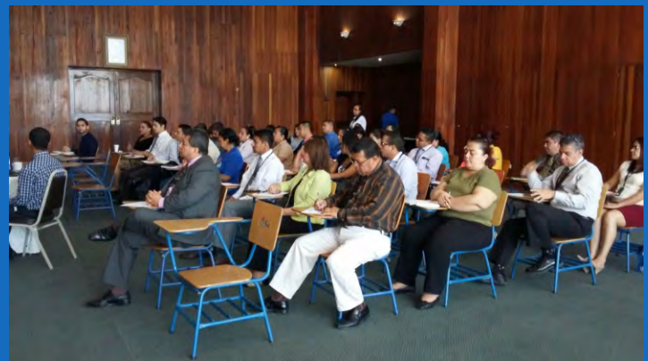
Las charlas impartidas a funcionarios y empleados del TSC desean fortalecer la cultura de probidad, ética, transparencia e integridad en la administración pública.

El Reglamento dispone que cada institución del Estado designará a un funcionario que sirva de enlace y coordine los