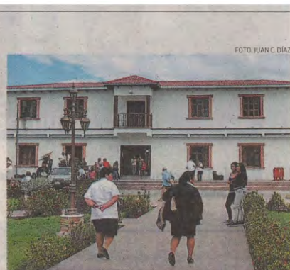
Fachada de la alcaldía de la Villa de San Antonio.

Redacción El Heraldo diario@elheraldo.hn