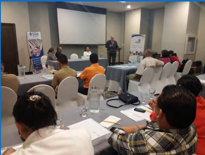
El magistrado presidente Mejía Espinoza durante la clausura del Taller, exhortó a los participantes a actuar con transparencia y profesionalismo en sus actividades edilicias.

La rendición de cuentas es la obligación de los servidores públicos de responder o dar cuenta, públicamente, tanto de la forma como se manejaron e invirtieron los recursos públicos confiados a su custodia, manejo o inversión, como de los resultados obtenidos y metas alcanzadas en su gestión.