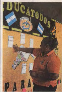
SECRETARÍA. El programa forma parte de Educación

El TSC encontró erogaciones indebidas, préstamos otorgados a empleados con fondos denominados ONG, que son de uso exclusivo para la compra de materiales educativos y suministros. Los préstamos se otorgaron con la justificación de que la Secretaría de Educación les retrasaba el pago de salarios; sin embargo, cuando recibieron los sueldos no devolvieron al programa el total de lo adeudado, lo que sumó L1,430,904.37.