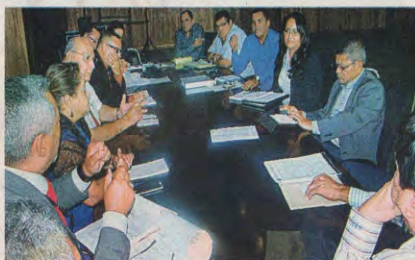
Alcaldes demandarán al Tribunal por publicar informes de auditorías sin estar firmes, aseguran.

Ante esa resolución indicó que "la Ley del Tribunal prevalece sobre la ley del IAIP en materia especial contralora y tal como lo establece la ley, nuestra función es informar".