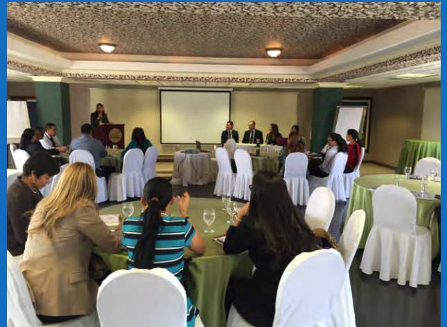
60 funcionarios de diferentes Direcciones y Departamentos del TSC recibieron el taller de capacitación sobre la implementación de las ISSAI.

Los dos talleres fueron dirigidos a 60 funcionarios y empleados pertenecientes a 11 Direcciones y Departamentos del TSC: Fiscalización de Bienes Nacionales, Municipalidades, Participación Ciudadana, Auditoría de Proyectos, Dirección de Auditorías, Seguridad y Justicia, Infraestructura e Inversiones, Económico y Finanzas, Recursos Naturales y Ambiente, Auditorías Especiales y Social.