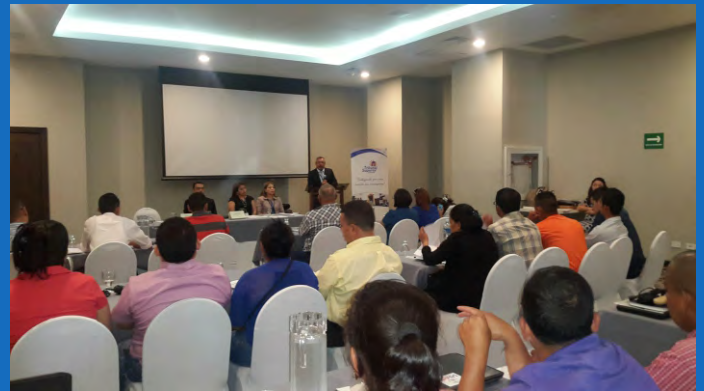
El Taller de Rendición de Cuentas se impartió con el objetivo de transmitir los conocimientos necesarios para un efectivo, eficaz y transparente manejo de los recursos del municipio.

Recibieron diplomas de participación y capacitación funcionarios de La Masica y San Francisco, departamento de Atlántida; Sabá y Bonito Oriental, Colón; San Francisco de Yojoa y San Manuel, Cortés; Lepaterique, Orica, San Antonio de Oriente, San Miguelito, Talanga, Tatumbla y Vallecillo, Francisco Morazán.