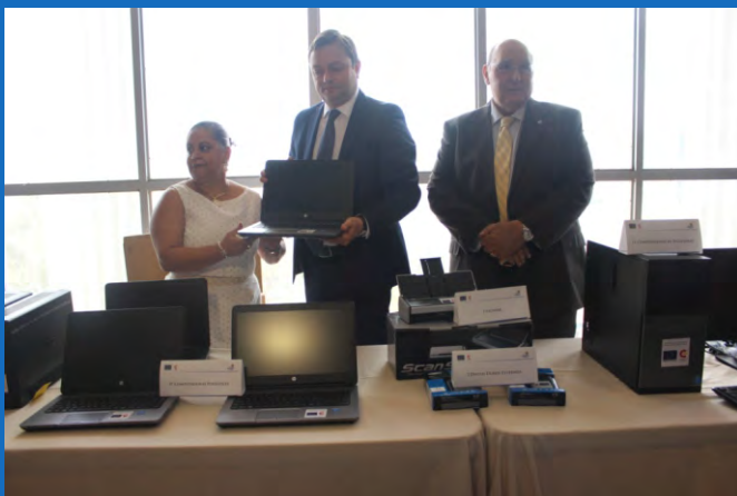
El equipo y mobiliario recibido por el TSC ayudará a los objetivos del Programa Eurojusticia que contribuye con los esfuerzos nacionales para combatir la impunidad de la corrupción, y garantizar el acceso a un sistema de justicia eficiente.

El Programa Eurojusticia plasma el compromiso de la Unión Europea y de España, a través de la AECID, con la democracia, el Estado de Derecho y los derechos humanos como valores fundamentales y objetivos que deben promoverse mediante las relaciones con el resto del mundo.