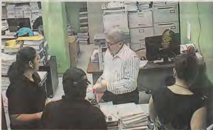
OPERATIVO. Elementos de la Atic y fiscales llegaron ayer a la Municipalidad a traer documentación relacionada con el caso.

Los terrenos. A petición formal de la concesionaria, los excorporativos, de acuerdo con el plan maestro, aprobaron la compra de los inmuebles para ejecutar la construcción de las plantas de tratamiento y la junta de concesiones, integrada por regidores, representantes del Colegio de Ingenieros Civiles, Cámara de Comercio