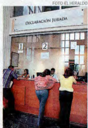
Instalaciones centrales del Tribunal Superior de Cuentas.

De los 34 exfuncionarios, 14 desempeñaron funciones en municipalidades, seis en Turismo, cuatro en la Secretaría de Educación, tres en Relaciones Exteriores y los siete restantes en el Consejo Hondureño de Ciencia y Tecnología (Cohcit), Salud, Universidad Nacional de