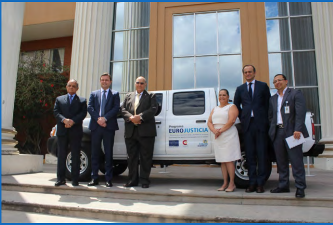
Los Magistrados del TSC, Miguel Ángel Mejía Espinoza y Daysi de Ancheta junto al embajador de la Unión Europea, Ketil Karlsen; el embajador de España, Miguel Albero Suárez e invitados especiales.

Una valiosa donación es entregada en el marco del Programa Eurojusticia- Promoviendo una justicia rápida y accesible en Honduras.