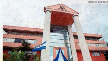
Las autoridades municipales deben presentar su informe al TSC.

Redacción El Heraldo diario@elheraldo.hn