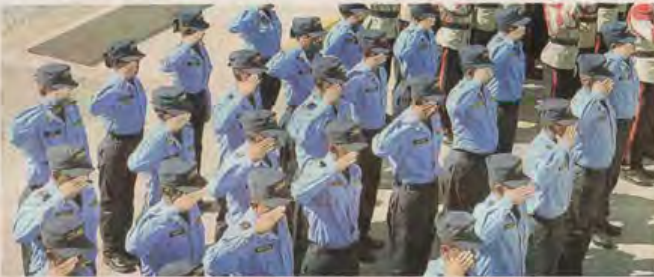
Las investigaciones de la DIECP continúan en la Policía Nacional.

Las autoridades del TSC ya deberán seguir 28 pasos, entre ellos verificaciones de movimientos en cuenta en la Comisión Nacional de Bancos y Seguros (CNBS), análisis de los patrimonios de los parientes cercanos, entre otros. Los expedientes también fueron enviados al Ministerio Público (MP) para que investiguen si existe un posible delito de lavado de activos.