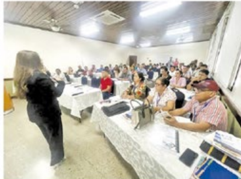
El TSC, la Segob y la Amhon buscan que haya transparencia en la administración municipal.

El programa integral de capacitación es facilitado por un equipo de expertos del TSC, de la Segob, Amhon, de la Oficina Normativa de Contratación y Adquisiciones del Estado (ONCAE) y de la Unidad de Financiamiento, Transparencia y Fiscalización de Partidos Políticos y Candidatos.