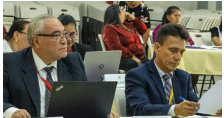
Audidores internos de varias entidades gubernamentales participando activamente en las sesiones del taller, enfocados en fortalecer sus conocimientos sobre pliegos de responsabilidad administrativa.

Asimismo, del Instituto Nacional de Previsión del Magisterio (Inprema), Instituto Nacional de Jubilaciones y Pensiones de los Empleados del Poder Ejecutivo (Injupemp), Comisión Nacional de Vivienda y Asentamientos Humanos (Convivenda), Programa Nacional de Desarrollo Rural