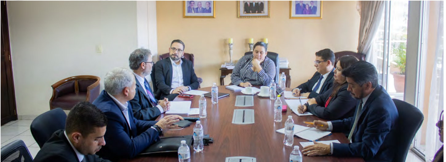
El Pleno de Magistrados del TSC y la delegación del BID durante la reunión en la que se abordaron avances de proyectos conjuntos y nuevas oportunidades de fortalecimiento para el ente contralor del Estado.

Tegucigalpa. El Pleno de Magistrados del Tribunal Superior de Cuentas (TSC) se reunió con una representación de alto nivel del Banco Interamericano de Desarrollo (BID) con el propósito de conocer avances de actividades desarrolladas con apoyo del organismo financiero y posible nuevas asistencias para el fortalecimiento del ente contralor del Estado.