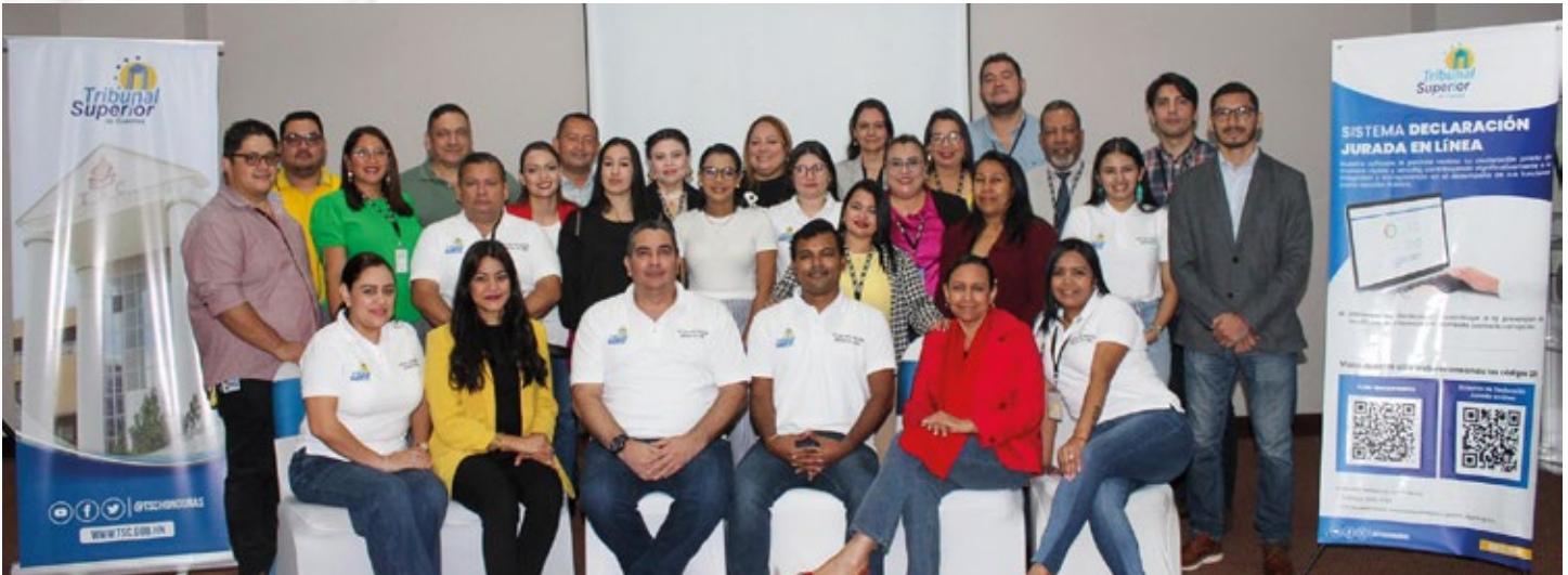
Facilitadores del Sistema Declaración Jurada en Línea junto a autoridades del TSC y representantes del BID, tras completar exitosamente la primera fase del taller de formación, en Tegucigalpa.

Tegucigalpa. El Tribunal Superior de Cuentas (TSC) desarrolló la primera fase del taller Formación de Facilitadores del Sistema Declaración Jurada en Línea del Tribunal Superior de Cuentas (TSC), dirigido a empleados y funcionarios de áreas operativas y administrativas del Ente Fiscalizador Superior.