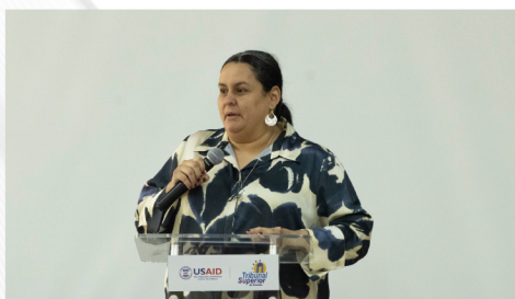
MAGISTRADA PRESIDENTA INAUGURÓ SEMINARIO TALLER SOBRE PLIEGOS DE RESPONSABILIDAD ADMINISTRATIVA