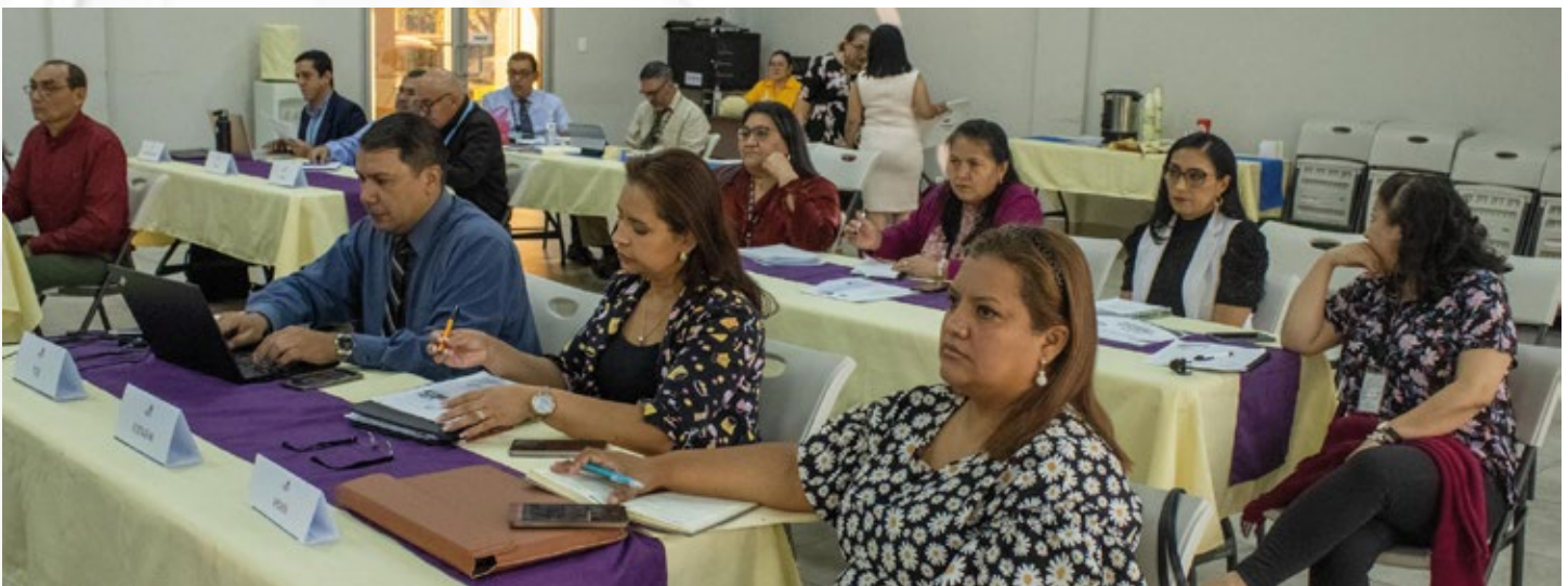
Auditores internos de diversas instituciones públicas durante la inauguración del seminario taller, atentos a las palabras de bienvenida de las autoridades del TSC.

Finalmente, les exhortó a poner en práctica lo socializado durante la presente jornada, enfocado en dos