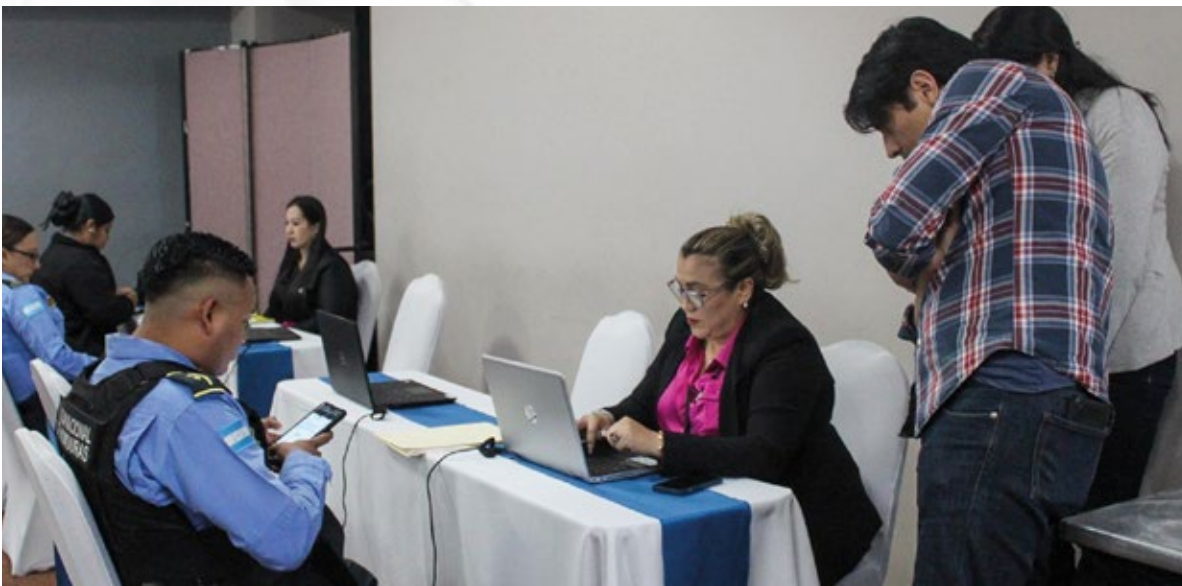
Personal regional del TSC comenzó a poner en práctica la declaración jurada en línea en mesas de ayuda.