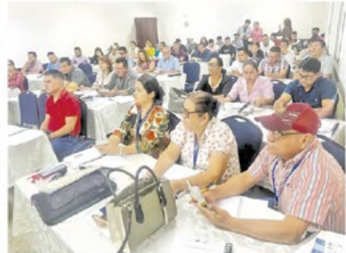
Los trabajadores aprenden además sobre leyes administrativas y sobre eficiencia de recursos.