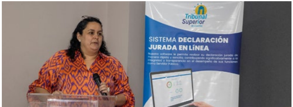
La magistrada presidenta del TSC, Itzel Anaí Palacios Sivady, inauguró el taller de Formación de Facilitadores del Sistema Declaración Jurada en Línea, destacando su importancia para fortalecer la transparencia y rendición de cuentas.

Al respecto, el Pleno se fijó la meta para febrero del año 2025, consistente del ofrecimiento de talleres dirigidos a