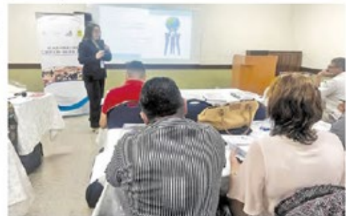
A la fecha se ha capacitado a empleados de 259 alcaldías de Honduras.