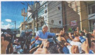
El precandidato presidencial y exalcalde nacionalista Nasy Asfura se defiende en libertad en esta causa.

De acuerdo al Ministerio Público, el desvío del dinero se realizó presun-