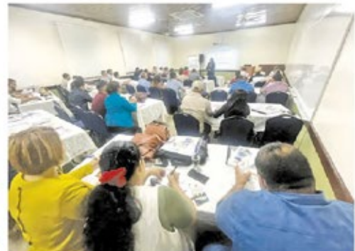
Se busca un mejor manejo de los recursos en cada una de las municipalidades del país.

El TSC contribuye a una sana administración de los recursos asignados a las municipalidades del país, acompañando en el fortalecimiento de las capacidades y revisión periódica de la gestión edilicia.