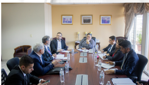
PLENO SE REUNIÓ CON REPRESENTACIÓN DEL ALTO NIVEL DEL BID