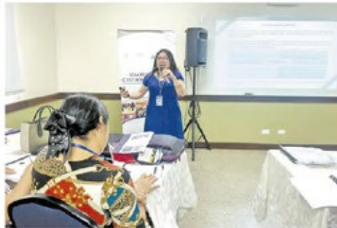
Las capacitaciones son impartidas por expertos del TSC, la Segob y la Amhon.

Durante tres días se abordará el Código de Conducta Ética del Servidor Público, deficiencias más comunes y recomendaciones, el Marco Rector del Control Interno Institucional de los Recursos Públicos (MARCI), Legislación Municipal, formulación y ejecución del presupuesto, Plan Anual de Compras y Contrataciones, Plan de Arbitrios y Aplicación de Valores Catastrales, entre otros.